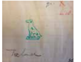
12b De foxhond onder modelnummer 46 ingetekend in het modellenboek van Goedewaagen, Streekarchief Midden-Holland, Archief Goedewaagen ac309, inv. nr. 110