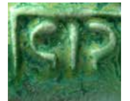
17b _____ Monogram van Gra Rueb op de pad