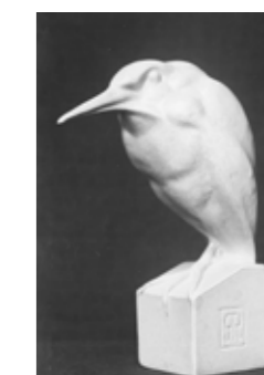
6 Moedervorm in gips van het woudaapje uitgevoerd door Gra Rueb, foto ca. 1926, fotoarchief Gra Rueb, collectie erven Gra Rueb