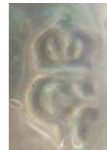
13b Blindstempelmerk GG met daarboven een kroontje, voorkomend op de Angorakat en andere plasticen van Gra Rueb, hoogte ca. 9 mm