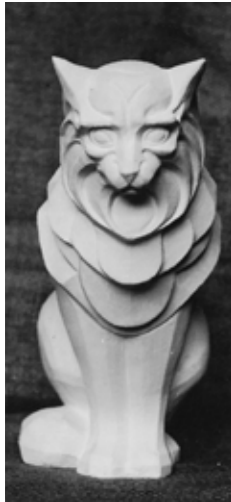
14 _____ Gipsmodel voor de angorakatkat uitgevoerd door Gra Rueb, foto ca. 1927, fotoarchief Gra Rueb, collectie erven Gra Rueb

Een bewaard gebleven exemplaar van de plastic met deze kleur glazuur draagt het gekroonde GG-blindstempel op de onderzijde (afb. 13a, b). In het fotoarchief van Gra Rueb is eveneens een foto van het door haar uitgevoerde gipsmodel aanwezig (afb. 14). In de monografie van Veth is de plastic verrassend genoeg op 1939 gedateerd. De informatie in Veth komt van Gra Rueb zelf, maar het ligt niet voor de hand dat Gra Rueb twee verschillende angorakatkaten heeft gemaakt en heeft laten uitvoeren bij Goedewaagen met twaalf jaar tijd ertussen. Zij heeft echter geen administratie bijgehouden van wat ze gemaakt heeft en moest daarom in 1946 uit haar geheugen putten, en daarbij