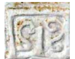
17c _____ Hetzelfde monogram op een bewaard gebleven gipsmodel van de pad