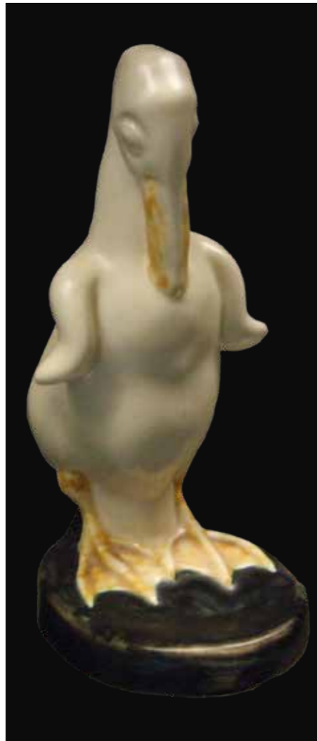
9, 10 Duikeend, 1926-1928 en ca. 1932, Goedewaagen Gouda, geglazuurd aardewerk, hoogte 9,9 cm, particuliere verzameling