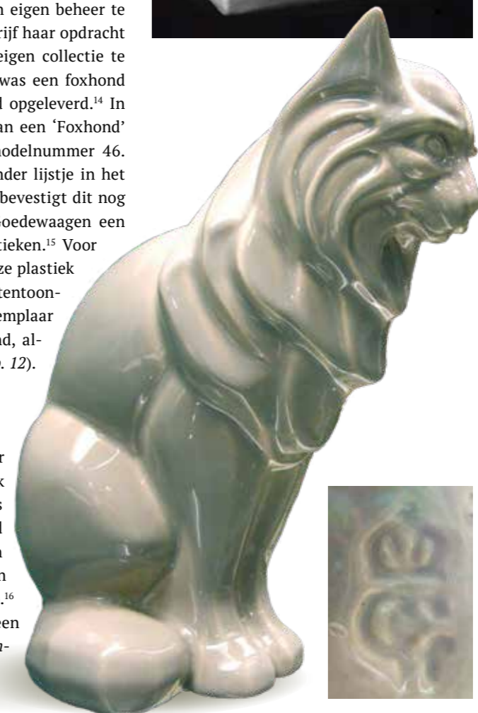
13a Angorakat, 1927-1928, Goedewaagen Gouda, geglazuurd aardewerk, hoogte 21 cm, Stedelijk Museum Breda, inv.no. g00167