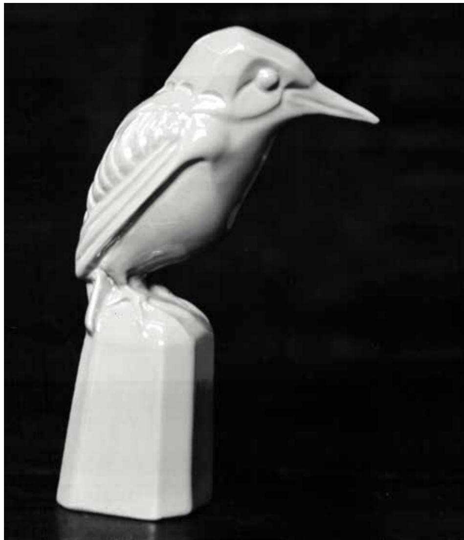
15 _____ Ijsvogel, Goedewaagen Gouda, geglazuurd aardewerk, foto ca. 1927

Naast een glazuurproef voor de angorakatkaten blijkt Dirk Abraham Goedewaagen op 22 juni 1927 eveneens een glazuurproef te hebben gemaakt voor een ijsvogel van