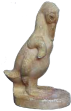
8 Gipsmodel voor de staande eend uitgevoerd door Gra Rueb, ca. 1926, hoogte 26,2 cm, particuliere verzameling