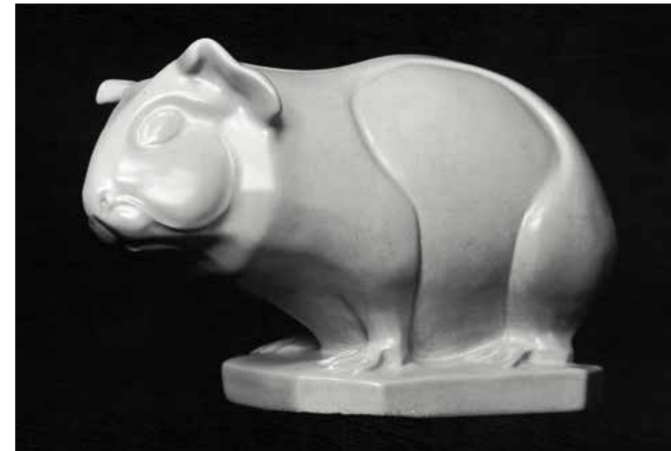
16 _____ Marmot, Goedewaagen Gouda, geglazuurd aardewerk, foto 1927-1928